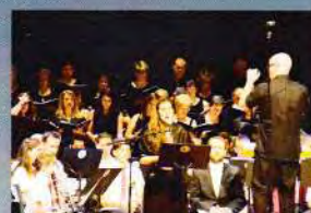
CORO ALMUDÁFER CORO INFANTIL DE LA ESCUELA DE MÚSICA DE CANET BANDA DE LA SOCIETAT MUSICAL DE CANET