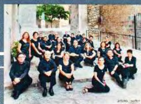
CORO JUVENTUDES MUSICALES DE SEGORBE