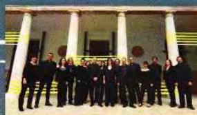
CORO VICTORIA MUSICAE