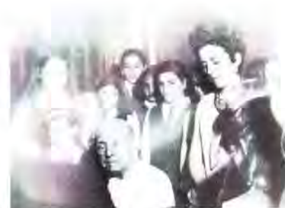
Pablo Casals con el CNSJ y su directora

Sin duda alguna, el CORO DE NIÑOS DE SAN JUAN tiene un sitio de preferencia en la historia musical de Puerto Rico, y será siempre reconocido como el pionero y sólido baluarte donde se promueve la excelencia musical en los niños y donde se cultiva con entusiasmo la música coral.