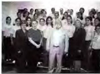
Krzysztof Penderecki y CNSJ