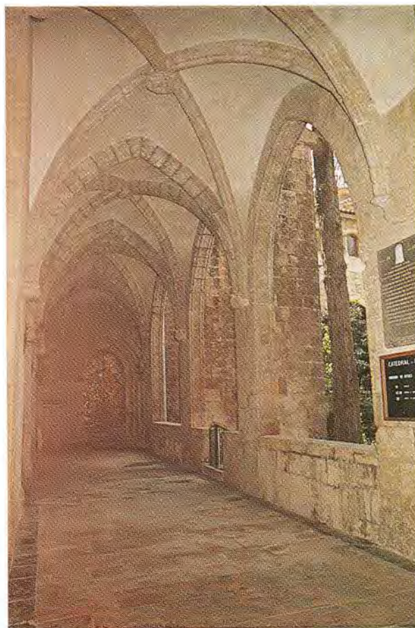
CLAUSTRO DE LA BASILICA-CATEDRAL - SEGORBE